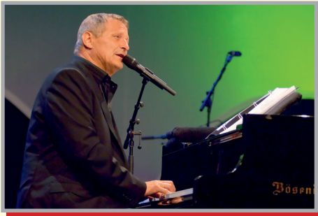
Konstantin Wecker Leben im Leben 13.03.2011